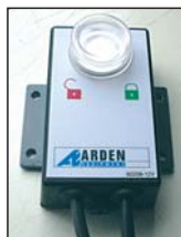
Опционально: Гидравлический комплект (пульт управления, Р.В.Д., соединения...)