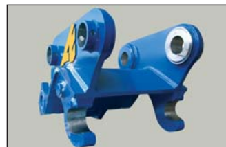
QA 70 H